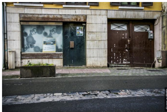
Figure 3 Commerce abandonné en centre-ville de Gonesse

Au lendemain de la COP 21, le type de développement proposé dans le cadre de ce projet, basé sur des émissions massives de gaz à effet de serre liées à la nature des attractions proposées et des trajets induits, ainsi que sur une destruction de terres agricoles de grande qualité est aux antipodes de celui à mettre en œuvre pour offrir un monde viable aux générations futures.